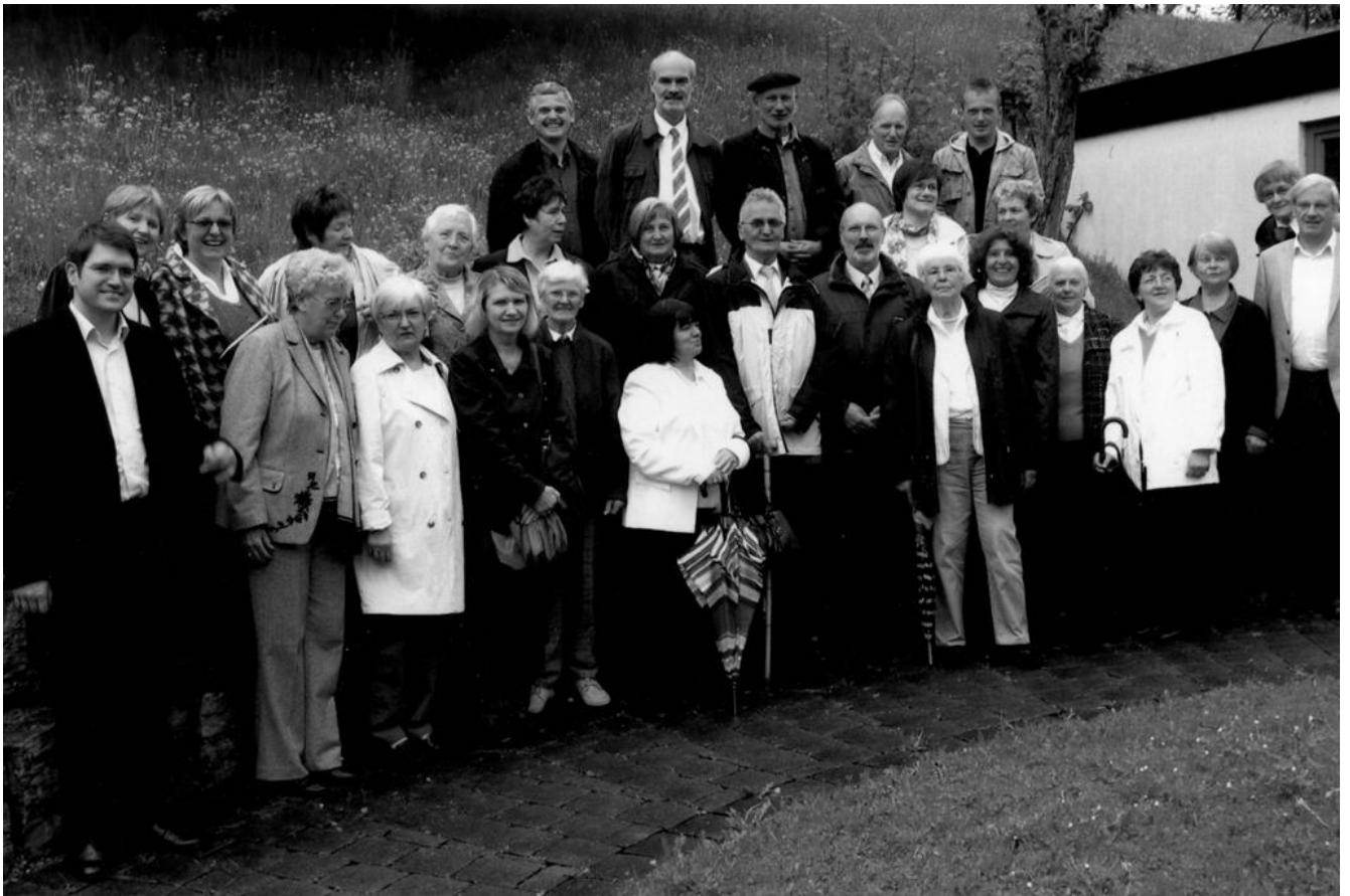
Kirchenchor der Gemeinden St. Josef, Maria zum guten Stein und aus den Albgemeinden.